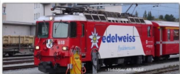
MD-60013.N; RhB Ge4/4" 618 rot, Werbemodell „fly edelweiss“, Spur N (9 mm), mit Rapidokupplung, MDS-Modell

Schnellzuglokomotive Ge4/4II 618, rot mit Werbemotiv „fly edelweiss“ N-Modell mit Standard-N-Kupplung