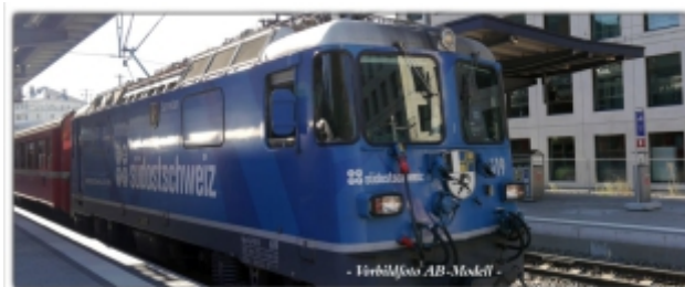
MD-60015.N; RhB Ge4/4" 619 blau, Werbemod. Südostschweiz, Spur N (9 mm), N-Kupplung, MDS-Modell

Schnellzuglokomotive Ge4/4II 619, blau Werbemodell Südostschweiz N-Modell mit Standard-N-Kupplung