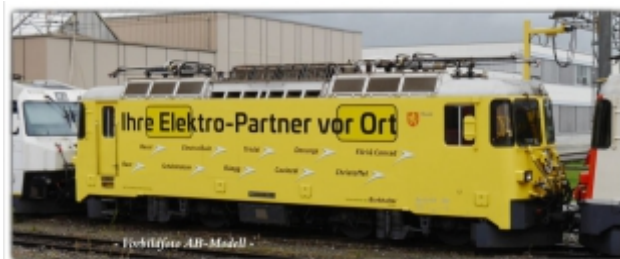
MD-60014.N; RhB Ge4/4" 612 gelb, Werbemod. Burkhalter-Gruppe, Spur N (9 mm), N-Kupplung, MDS-Modell

Schnellzuglokomotive Ge4/4II 612, gelb Werbemodell der Burkhalter-Gruppe N-Modell mit Standard-N-Kupplung