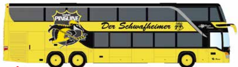
Limitiert 400 LC4477 SETRA S 431 DT KEV Mannschaftsbus Krefelder Pinguine UVP 29,98 €

Bedeutung gewann der S 431 DT insbesondere durch das stark wachsende Fernbusgeschäft.