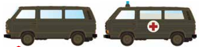
Limitiert 300 LC4337 VW T3 Set Militär Schweiz UVP 21,98 €