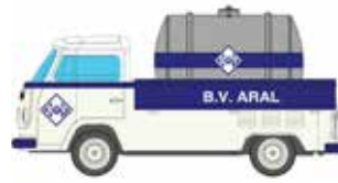
Limitiert 400 LC3893 VW T2 Tankwagen ARAL UVP 11,99 €