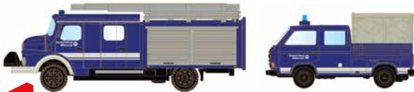
Limitiert 500 LC4205 LF 16 TS + VW T3 THW UVP 39,90 €