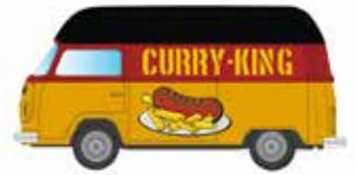
Limitiert 400 LC3876 VW T2 Imbiss-Wagen UVP 11,99 €