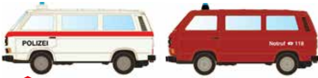
Limitiert 300 LC4335 VW T3 Set Polizei -Feuerwehr Schweiz UVP 21,98 €