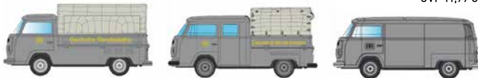
Limitiert 350 LC3871 VW T2 3-er Set DB UVP 29,95 €