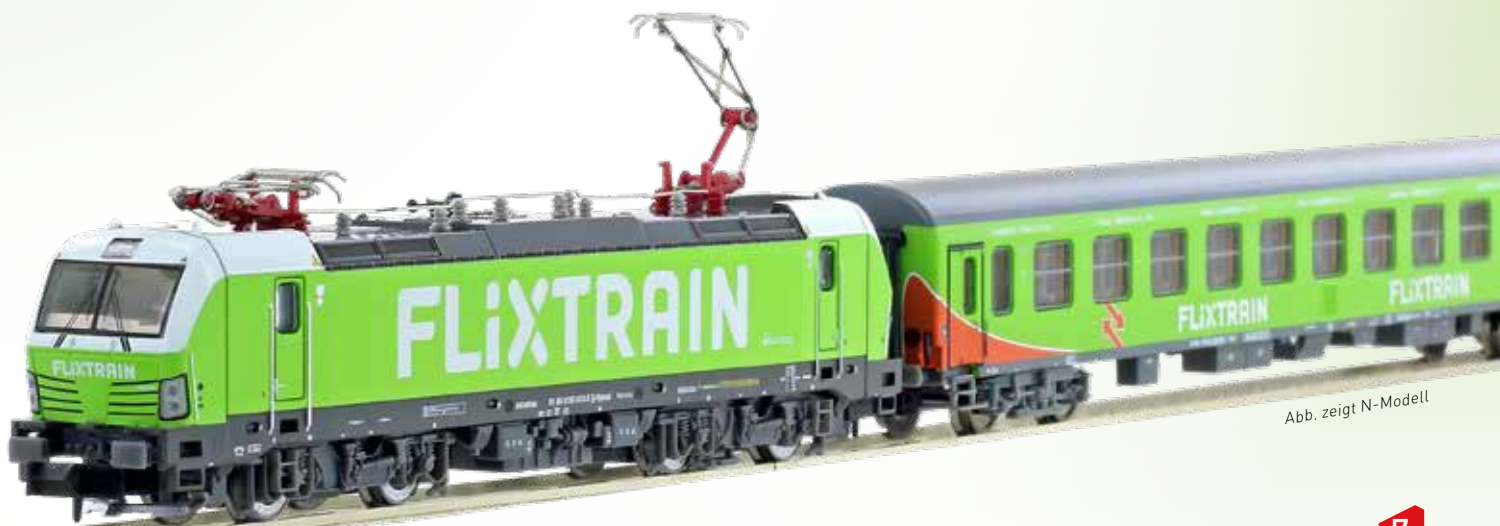
Abb. zeigt N-Modell

LS46008 Liegewagen D-BTEX 61 80 59-91 047-9 Bvcmz 248.5, grün/orange, Dach fenstergrau, Flixtrain/BTE, Linie Hamburg - Köln Ep.VI (2019) Liegewagen (behindertengerecht) D-BTEX 61 80 59-90 035-6 Bvcmbz 249.1, grün/orange, Dach basaltgrau, Flixtrain/BTE, Linie Hamburg - Köln Ep.VI (2019) UVP 164,90 €