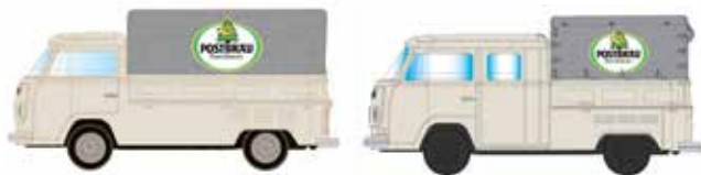
Limitiert 350 LC3899 VW T2 Set Postbräu UVP 19,95 €