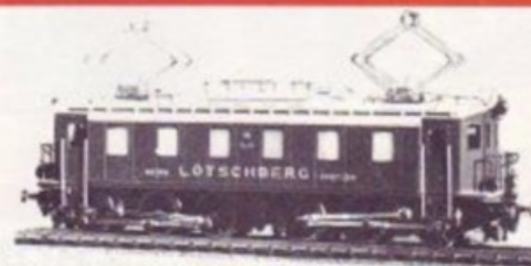
3008 BLS Ce 6/6 VERT/GRÜN