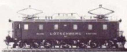
3006 BLS Ae 5/7 VERT/GRÜN