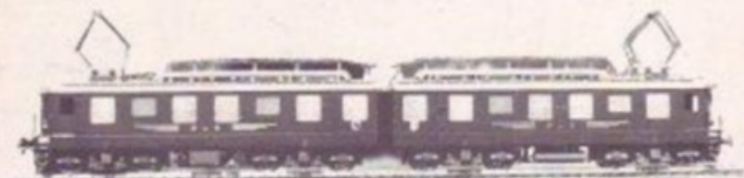
3011 BLS Ae 8/8 BRUN/BRAUN