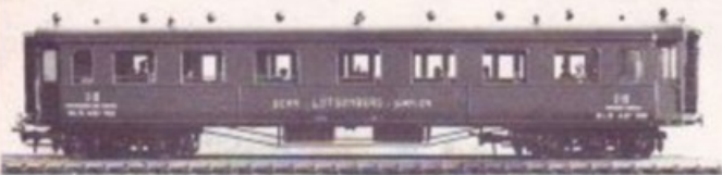
4000 BLS 1-2. KLASSE