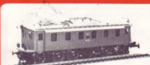
3009 BN Ce 6/6 BRUN/BRAUN