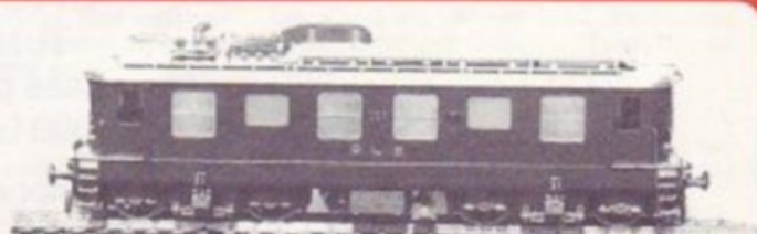
3010 BLS Ae 4/4