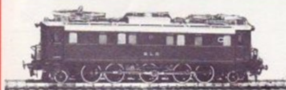
3005 BLS Ae 5/7 BRUN/BRAUN