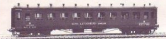
4010 BLS 3. KLASSE