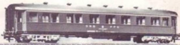
4050 SBB-CFF UIC 1. KLASSE