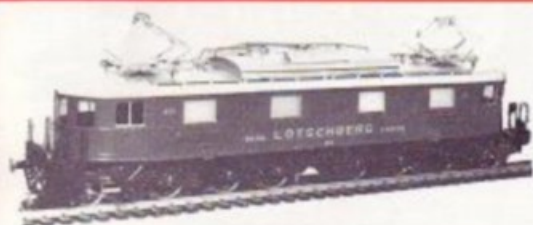
3001 BLS Ae 6/8 205