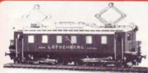
3007 BLS Ce 6/6 BRUN/BRAUN