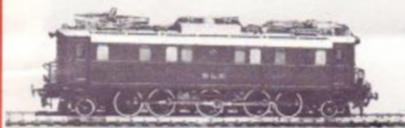
3003 BLS Be 5/7 BRUN/BRAUN