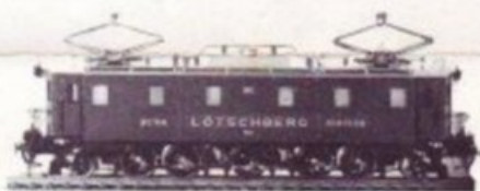
3004 BLS Be 5/7 VERT/GRÜN