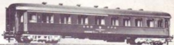
4060 SBB-CFF UIC 1-2. KLASSE