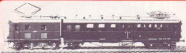
3012 BLS CFe 2/6 BRUN/VERT - BRAUN/GRÜN