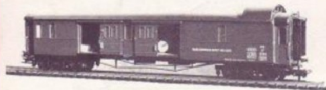
4030 BLS MAGAZIN/REPARATION