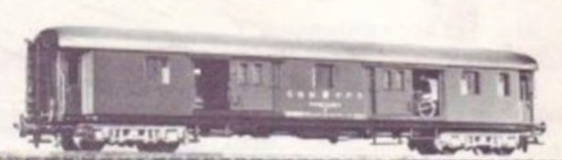
4080 SBB-CFF UIC FOURGON/PACKWAGEN