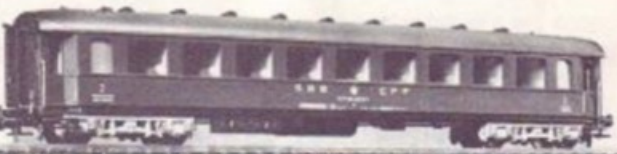
4070 SBB-CFF UIC 2. KLASSE