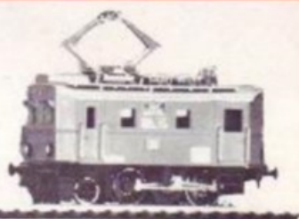
3013 BLS TE 2/3