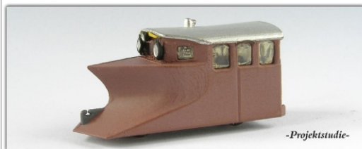
Nm-xxx.x: RhB Dienstfahrzeug Schneepflug X 9103

Denkbar wären drei Ausführungsvarianten: im ursprünglichen Grau, in Orange und in Rostrot. Zur Verfügung stünden die Betriebsnummern X 9102 bis X 9104. Der abgebildete X 9103 ist in dieser Lackierung seit Jahren in Samedan am Ende der Rangiergleise abgestellt.