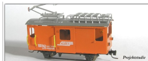
Nm-000.0: RhB Rangiertraktor der Berninabahn De2/2 151