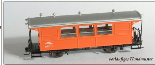
Nm-104.2: RhB Dienstwagen der Berninabahn Rottenwagen für Baudienst X 9079

Das Handmuster hat noch ein Dach mit Lüftern und Steckdosen erhalten, die bei der endgültigen Ausführung nicht vorhanden sind.