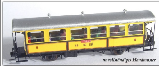
Nm-106.1: RhB historischer Zweiachser der Berninabahn BC110 - aktueller Zustand

Wir setzen in diesem Jahr die Serie der historischen Fahrzeuge der Rhätischen Bahn fort und bieten Ihnen im Laufe des Jahres 2011 den BC 110 als Neukonstruktion an. Das Modell wird aus Neusilber bestehen, vorbildliche Dachlüfter und Dachsteckdosen haben und durch feine Messingzurüstteile vervollständigt.