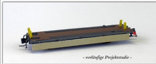
Nm-016.1: RhB Tragwagen für Abrollcontainer mit abgeklappten Seitenwänden, Kp-w 7501 ff.

Bereits im vergangenen Jahr kündigten wir die Tragwagen für Abrollcontainer als Projektstudien an. Mittlerweile ist das Projekt soweit gediehen, dass wir davon ausgehen, dass die Tragwagen in diesem Jahr Serienreife erlangen werden. Passend dazu tüfteln wir derzeit noch am passenden, typischen RhB-Kehricht-Container in rot mit weißer Beschriftung. Es wird mehrere Fahrzeugnummern für jeden der beiden Typen geben, so dass ein kompletter Kehricht-Zug zusammen gestellt werden kann.