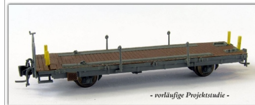
Nm-016.2: RhB Tragwagen für Abrollcontainer Kp-w 7501 ff.

Die gelben Sicherungszapfen der Projektstudie werden bis zur endgültigen Ausführung noch überarbeitet.