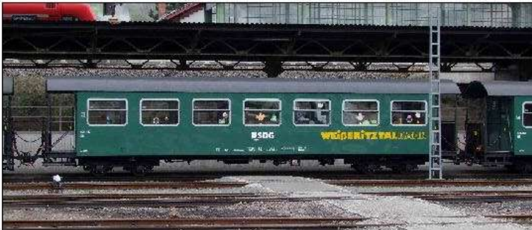
970-452 DR / 970-452 SDG

970-448, - SDG : Bausatz 80,-- Fertigmodell 145,--