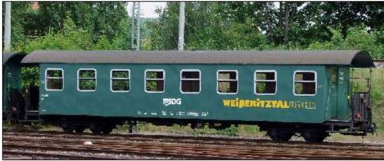
970-448 DR / 970-448 SDG

Ab November 1990 wurden noch 4 ehemalige Einheitswagen in Perleberg nach dem dort entwickelten Baukastenprinzip rekonstruiert.