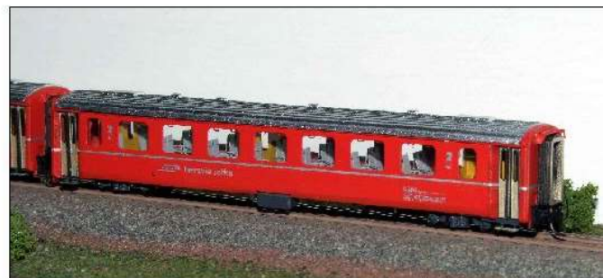
EW II B (2.Kl.)

Noch nicht lieferbar (Neuheiten 2014) : Nenngröße HOe (1 : 87)