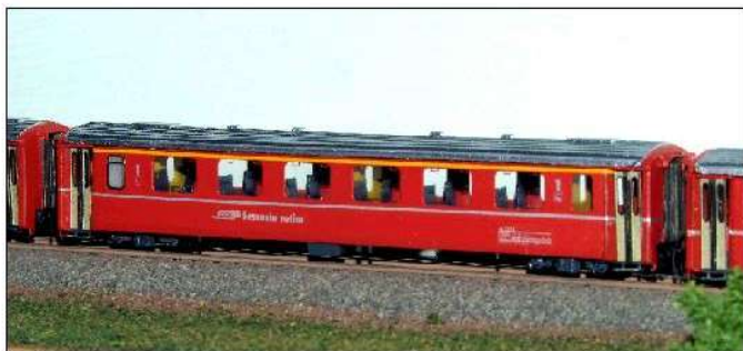
EW II A (1. Kl.)

Als Weiterentwicklung des in den 60er Jahren in großer Stückzahl auch von der RhB beschafften Einheitswagen I wurden ab 1975 ca. 67 Wagen des Typs EW II beschafft, die sich vom Vorgängertyp durch geringeres Gewicht und vergrößerte Sitzteiler unterschieden. Die für das Stammnetz bestimmten Wagen waren 18500 mm lang. Die RhB beschaffte Wagen 1-., 1. und 2. Kl. und reine 2.-Kl.-Wagen.