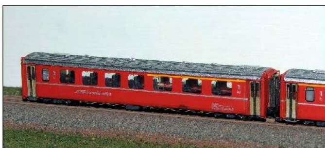
EW II AB (1.+2.Kl.)

EW II A, EW II AB, EW II B: Bausatz 84,-- Euro Fertigmodell 180,-- Euro